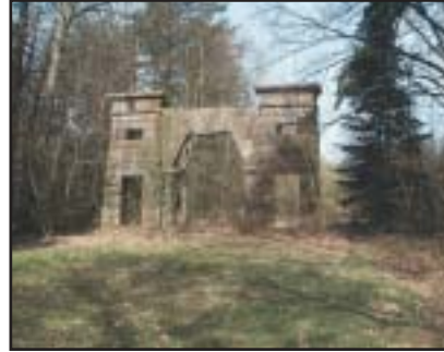
Four à pain

Chapelle Saint Job (rue Anne de Bretagne - bourg) : l'architecture de la chapelle Saint Job (1620-1874) ne manque pas d'originalité avec son assise élargie à la base. Le retable sur lequel Job est représenté date de 1671.