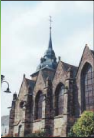
Église de Louigné-de-Bais