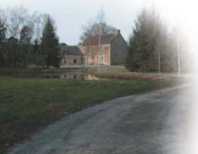
Manoir de la Touche (propriété privée)

(XII-XVI-XVIII e ) : d'origine romane, reprise en style gothique flamboyant, elle a été agrandie au XVIII e siècle. Prenez un peu de temps pour entrer si son accès est possible. Les vitraux sont tous d'une grande richesse de coloris et sont, pour les cinq plus anciens (classés Monuments Historiques) l'œuvre de maîtres verriers vitréens. Sur certains vitraux figurent les armoiries de trois familles de seigneurs importants de la commune (familles des Poix de Fouesnel, le Sénéchal et d'Espinay). L'autel en marbre noir et le retable en bois sculpté doré datent de 1698. Composé d'une tour carrée à trois étages datée de 1760, le clocher est peu élevé et composé à son sommet d'un petit dôme terminé par une flèche. La troisième cloche actuelle fut fondue sur place en 1539 ou 1540.