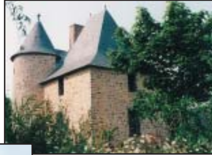
Manoir de la rivière Rabault

Le Lac : camping 2**, 61 places, situé au bord de l'étang herbeux, ombragé, terrain tranquille, site agréable qui permet de nombreux loisirs (activités nautiques, pêche, tennis...), ouvert du 15 mai au 30 septembre.